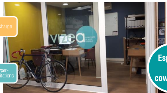
L’AGENCE DE BORDEAUX