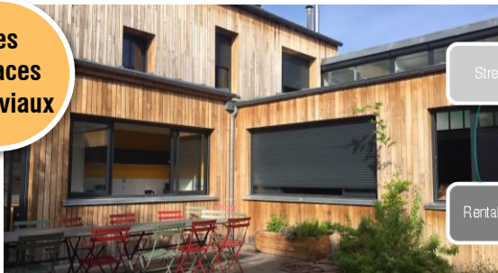
L’AGENCE DE MALAKOFF – JARDIN ET FAÇADE BOIS