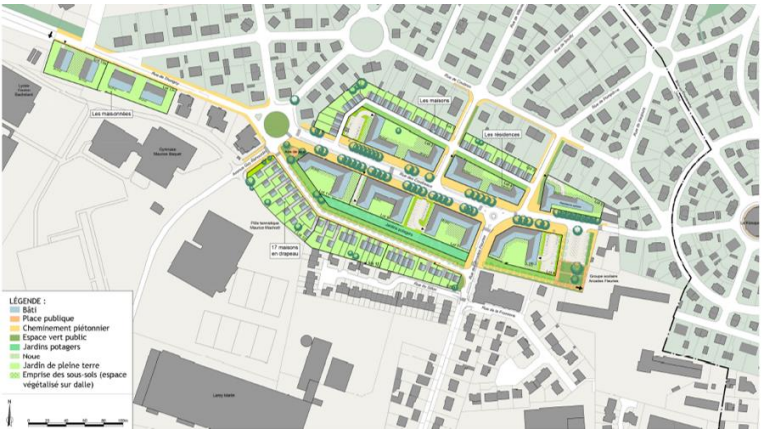
PLAN MASSE DU PROJET ©ATELIER CHOISEUL