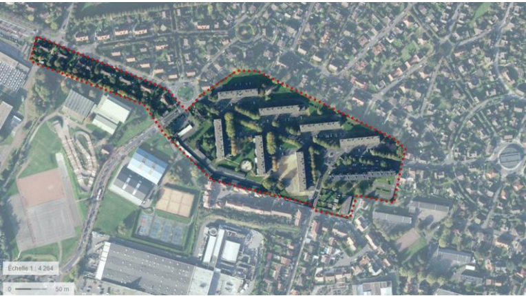
PHOTO AERIEENNE DU QUARTIER DES ARCADES FLEURIES

Le projet de requalification du quartier des Arcades Fleuries est une opération d’aménagement sur une friche, au sens du patrimoine immobilier social vieillissant devant faire l’objet d’une intervention lourde dans une démarche de production de logements de qualité, tout en proposant un quartier plus qualitatif. Compte-tenu de l’implantation actuelle des bâtiments, le projet prévoit leur démolition mais en doublant le nombre de logements sur ce même périmètre.