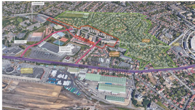
VUE AERIEENNE DES ARCADES FLEURIES ET DE SES ABORDS