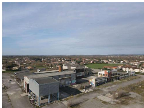
Etat actuel de la friche