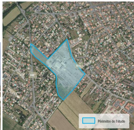
Localisation du projet dans son environnement proche

Le futur cœur de quartier dit de « La Sabla » est situé en agglomération, à la sortie de la ville de Plaisance du Touch sur une ancienne friche industrielle et à la lisière entre des zones résidentielles et agricoles.