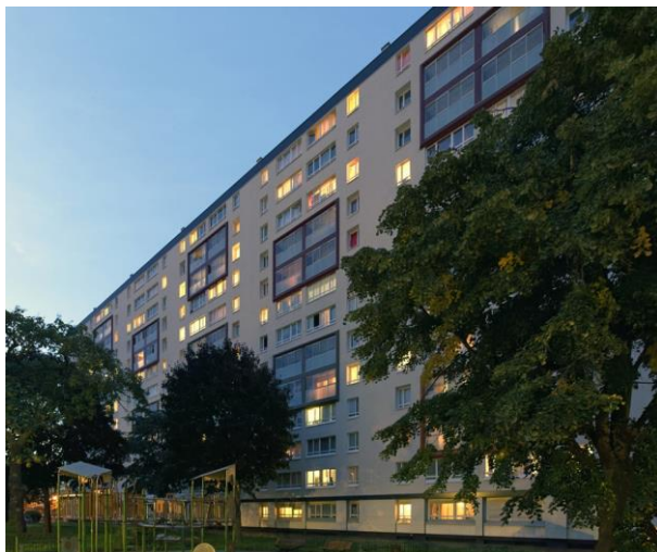
PHOTO DE LA RÉHABILITATION DU BÂTIMENT GRAND COLOMB EN 2017