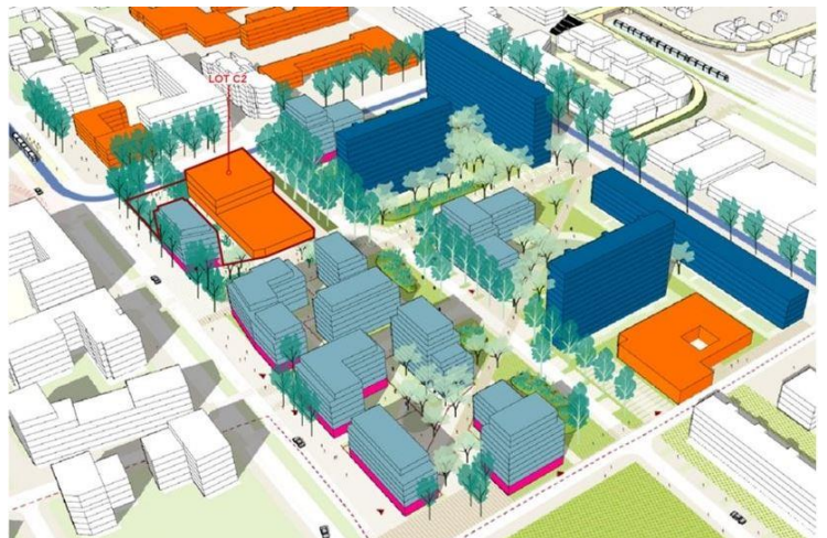
PLAN DE PROGRAMMATION DU QUARTIER NAVIGATEURS COSMONAUTES

Vizea, dans son rôle d'AMO, accompagne l'EPT Grand-Orly Seine Bièvre sur la définition des enjeux environnementaux et la stratégie environnementale à adopter en vue de l'obtention du label EcoQuartier. Une synergie est mise en œuvre entre les acteurs ressources du territoire pour mobiliser leurs connaissances et leurs expériences. Vizea a également pu réaliser l'étude environnementale « Cas par Cas » pour l'aménageur Expansiel (groupe Valophis).