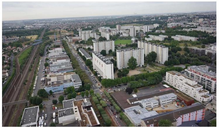
PHOTO AÉRIENNE DU SITE

Le projet de renouvellement urbain Choisy Sud, comprenant la ZAC Navigateurs Cosmonautes, s'inscrit dans les axes du contrat de ville aujourd'hui porté par l'EPT Grand-Orly Seine Bièvre. Il a vocation de transformer ce quartier prioritaire de la politique de la ville de Choisy-le-Roi de manière globale et exemplaire, d'un point de vue urbain, économique, social et environnemental.