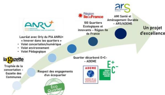
APPELS A PROJET POUR LESQUELS LE PROJET A ÉTÉ LAURÉAT