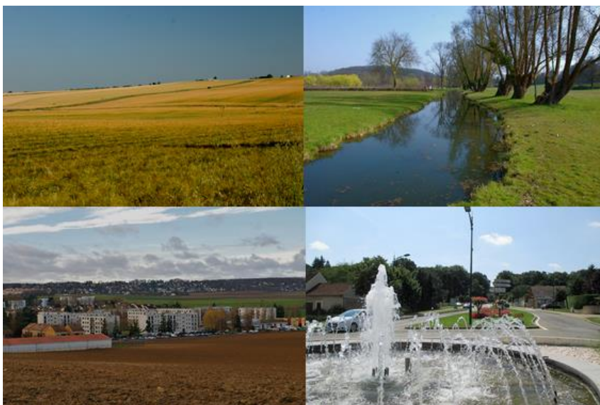
Photos du territoire

Située sur la plaine de Versailles, la Ville de Plaisir a connu un fort développement entre 1960 et 1974, conséquence de la création de la ville nouvelle de Saint-Quentin-en-Yvelines, avant de voir sa population se stabiliser autour de 32 000 habitants. Au cœur des Yvelines et à proximité du Parc Naturel Régional de la Haute Vallée de Chevreuse, Plaisir se caractérise par un cadre de vie privilégié.