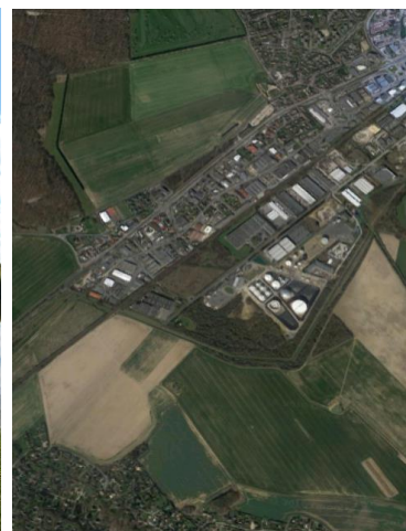
Vue satellite du site