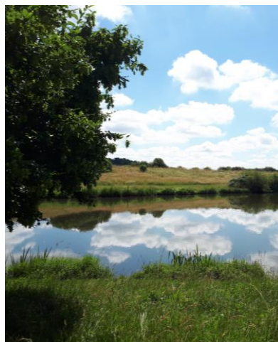
Environnement à proximité du site, juin 2018 (Vizea)