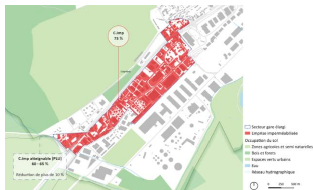
Coefficient d'imperméabilisation du secteur élargi (Vizea)

Le secteur Gare élargi de Coignières se place en entrée de ville et marque la limite entre la Communauté d'Agglomération de Saint Quentin en Yvelines (CASQY) et la Communauté d'Agglomération de Rambouillet Territoires. Le secteur se place à la charnière entre parcelles urbanisées, zones de protection, espaces naturels remarquables et le paysage agricole. Il se caractérise aujourd'hui par une importante emprise dédiée à l'activité, aux surfaces fortement imperméabilisées.