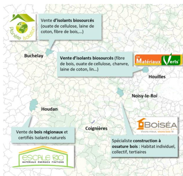
Acteurs locaux de la construction bas carbone (Vizea)

Vizea intervient au sein du groupement porté conjointement par BAU et CBRE afin de déceler et de répondre aux dynamiques et enjeux environnementaux du site et de ses alentours.