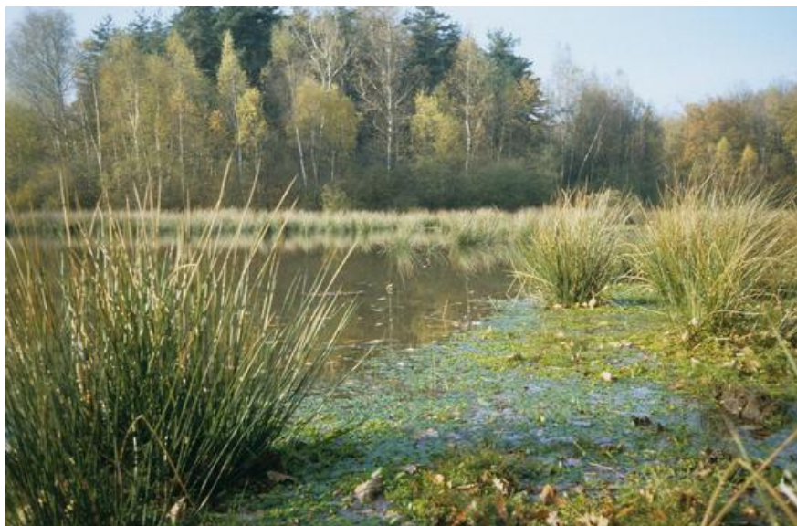
PHOTOGRAPHIE DE LA FORÊT DOMANIALE DE RAMBOUILLET

La Communauté d'agglomération de Rambouillet Territoires a choisi depuis plusieurs années un modèle de développement de type « smart » associant le développement économique, la préservation de la qualité de vie et la mise en œuvre de réseau intelligent. Rambouillet Territoires a également décidé de se saisir de la problématique du changement climatique et d'agir concrètement en mettant en place son Plan Climat-Air-Énergie Territorial (PCAET) qui constitue le volet « lutte contre le changement climatique et protection de l'atmosphère » de son Agenda 21. Ce territoire au marge de la région Ile-de-France présente des enjeux Air Energie Climat bien différents du contexte régional nécessitant une prise en compte dans le plan d'actions.