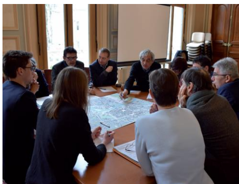
ATELIER DE CONCERTATION ROMORANTIN