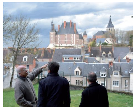
VISITE DE LA COMMUNE DE GIEN