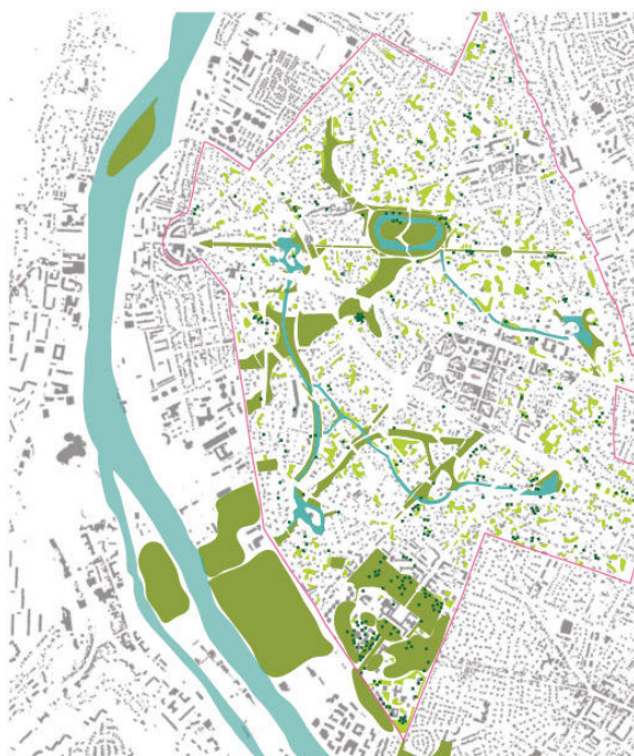
Le projet au sein de la TVB du Vésinet – Agence TER