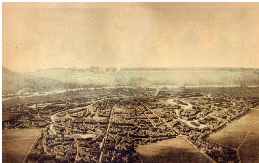
1835 : Création de la ville-parc du Vésinet – Image d'archive