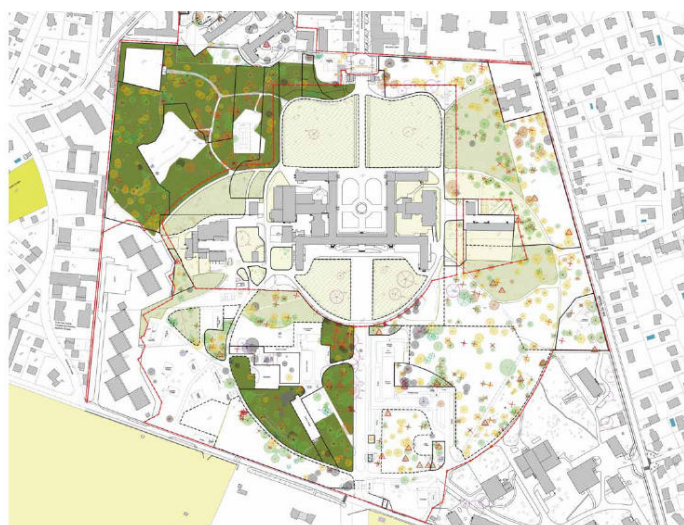
Synthèse des enjeux écologiques – Agence TER