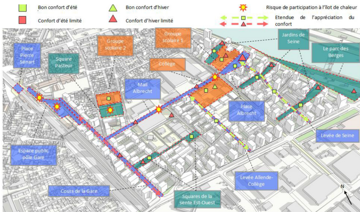
EXEMPLE DE RENDU D'UNE ETUDE LESEnR

LesEnR réalise l'étude aéraulique et d'ensoleillement de la ZAC basée sur des modélisations faites sur le modèle architectural en 3D afin de déterminer les zones de confort et d'inconfort à différents niveaux (RDC, R+2, R+5 et R+12)