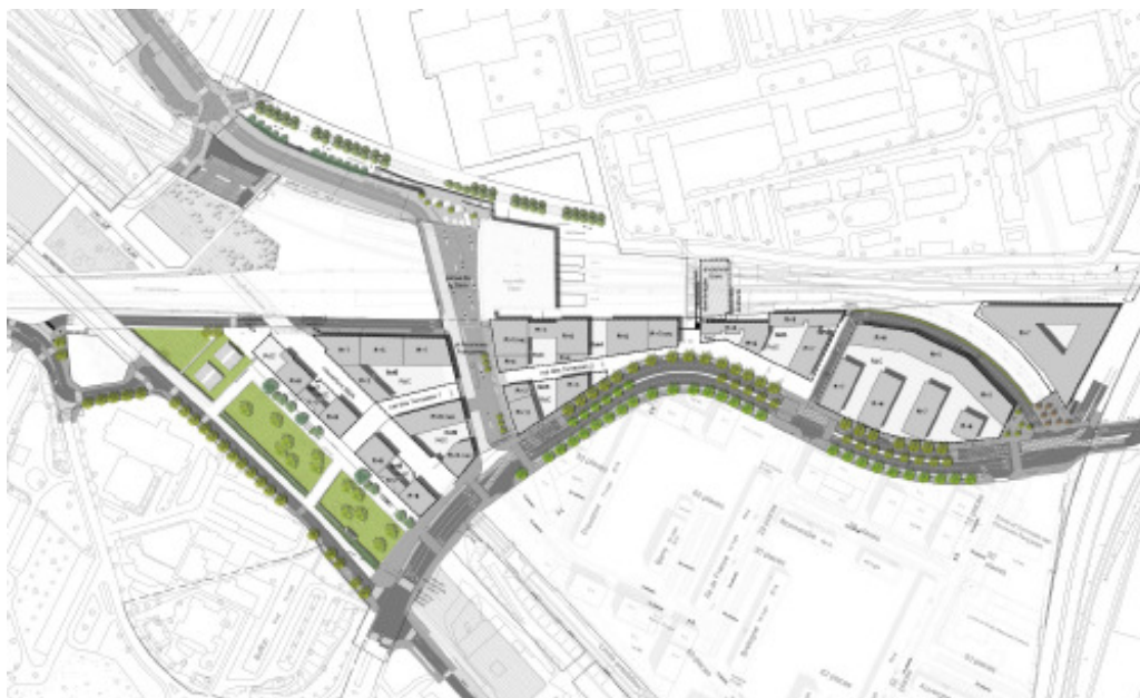
Plan de masse

L'opération « Coeur de Quartier » s'intègre dans l'aménagement de la ZAC Seine Arche. Il s'inscrit dans la démarche de qualité environnementale voulue par l'EPADESA à travers l'élaboration de sa Charte de développement durable en avril 2007. Il propose la création d'un pôle attractif au nord du boulevard des Provinces-Françaises mêlant bureaux, logements et commerces, à proximité de la gare Nanterre-Université. Une réflexion forte sera menée sur la mixité des fonctions, les espaces publics, la limitation des consommations énergétiques, le recours aux énergies renouvelables et la création de liaisons douces afin de réaliser un véritable « Coeur de Quartier » autour de la gare intermodale Nanterre Université.