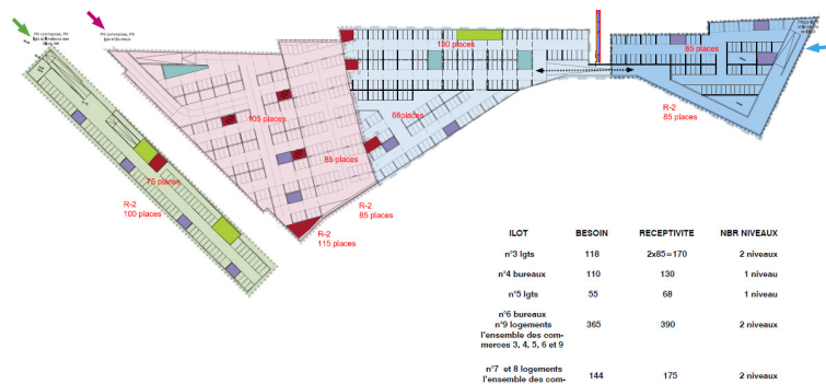
Plan d'implantation des parkings souterrains