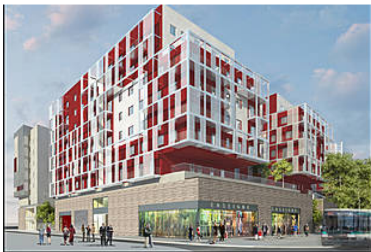
Perspective du projet

L'opération « Coeur de Quartier » s'intègre dans l'aménagement de la ZAC Seine Arche. Il s'inscrit dans la démarche de qualité environnementale voulue par l'EPADESA à travers l'élaboration de sa Charte de développement durable en avril 2007. Il propose la création d'un pôle attractif au nord du boulevard des Provinces-Françaises mêlant bureaux, logements et commerces, à proximité de la gare Nanterre-Université. Une réflexion forte sera menée sur la mixité des fonctions, les espaces publics, la limitation des consommations énergétiques, le recours aux énergies renouvelables et la création de liaisons douces afin de réaliser un véritable « Coeur de Quartier » autour de la gare intermodale Nanterre Université.