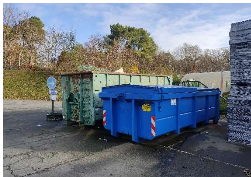
Sites visités lors des études d'accompagnement (Vizea)