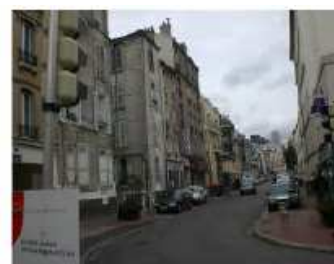
Rue Emile Duclaux

Dans le cadre de divers projets d'aménagement du quartier Carnot-Gambetta, mêlant des projets de logements, d'équipements publics, tertiaires ou commerciaux, la ville de Suresnes souhaite mettre en œuvre un mode de développement urbain concerté et exemplaire en matière de construction durable, d'efficacité énergétique et de réduction des émissions de gaz à effet de serre. Les méthodes et les résultats de cette démarche, dans un premier temps développés sur un quartier pilote, seront ensuite capitalisés afin de permettre leur reproductibilité sur les autres quartiers de la ville.