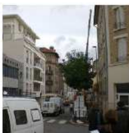
Rue du Ratrait