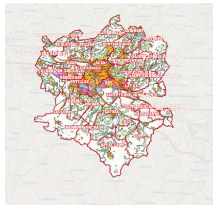
CONSOMMATIONS D'ENERGIE FINALE ET EMISSIONS DE GES DU TERRITOIRE

Ville centre de l'agglomération Agenaise, Agen, dispose d'une position stratégique entre deux Métropoles : Bordeaux et Toulouse. Distant de 132 km de Bordeaux (1h10), Agen est également située à 107 km de Toulouse (soit 1h).