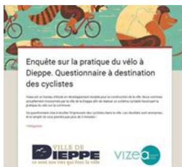
Questionnaire en ligne pour les cyclistes (Vizea)

Vizea propose l'élaboration de schémas directeurs cyclables permettant une pratique optimisée grâce à la mise en place d'actions variées et l'intégration de la population à toutes les étapes de la démarche.