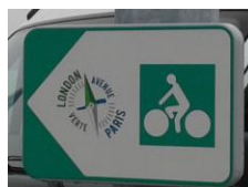
Photographies terrain (Vizea)