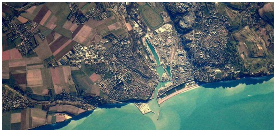
Photographie satellite illustrant les enjeux topographiques de la pratique du vélo à Dieppe

Avec les enjeux environnementaux croissants qui pèsent sur les villes (qualité de l'air, changement climatique, environnement sonore, etc.) il est nécessaire de repenser en profondeur nos habitudes et nos schémas de mobilité afin de conserver et d'améliorer qualité de vie et confort pour les habitants et les usagers. La mobilité douce et en particulier le développement de la pratique cyclable s'impose ainsi comme une thématique majeure du développement durable, dont elle constitue une application concrète et opérationnelle, relativement simple à mettre en oeuvre.