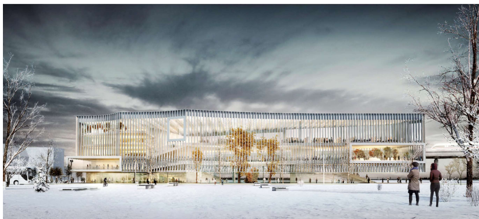
Vue du parvis