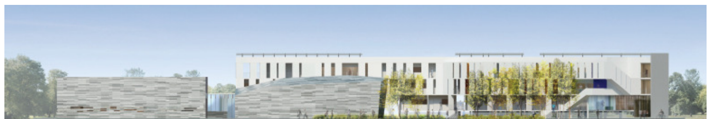
Vue de la façade sud