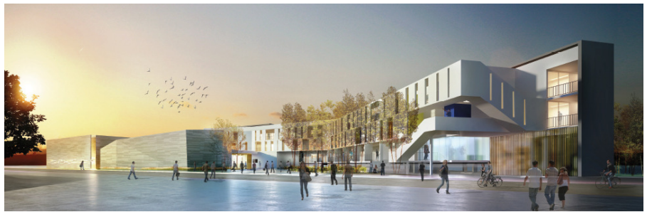
Vue du parvis