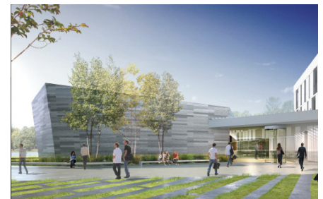
Vue depuis l'entrée