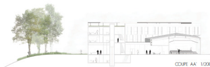
COUPE AA' 1/200

L'Université de Cergy-Pontoise (UCP) souhaite développer un Institut d'Etudes Avancées (IEA), en se groupant la Maison de la Recherche pour ne former qu'une seule entité la Maison Internationale de Recherche. LesEnR s'engage à accompagner la MOA à suivre la démarche HQE pour la réalisation de ce bâtiment. La Maison Internationale de la recherche devra inclure un espace de détente réservé à l'accueil des usagers ainsi que pour leurs familles, cette structure devra parfaitement s'intégrer dans la ZAC durable.