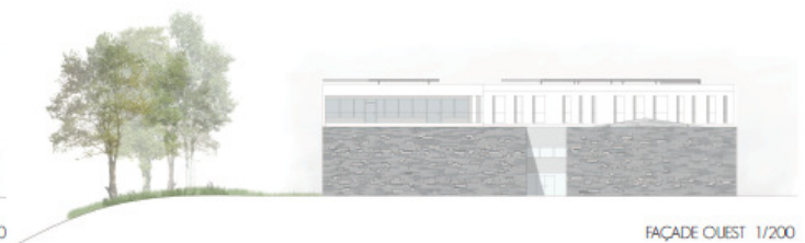
FAÇADE OUEST 1/200