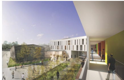
Vue depuis la courserie des logements