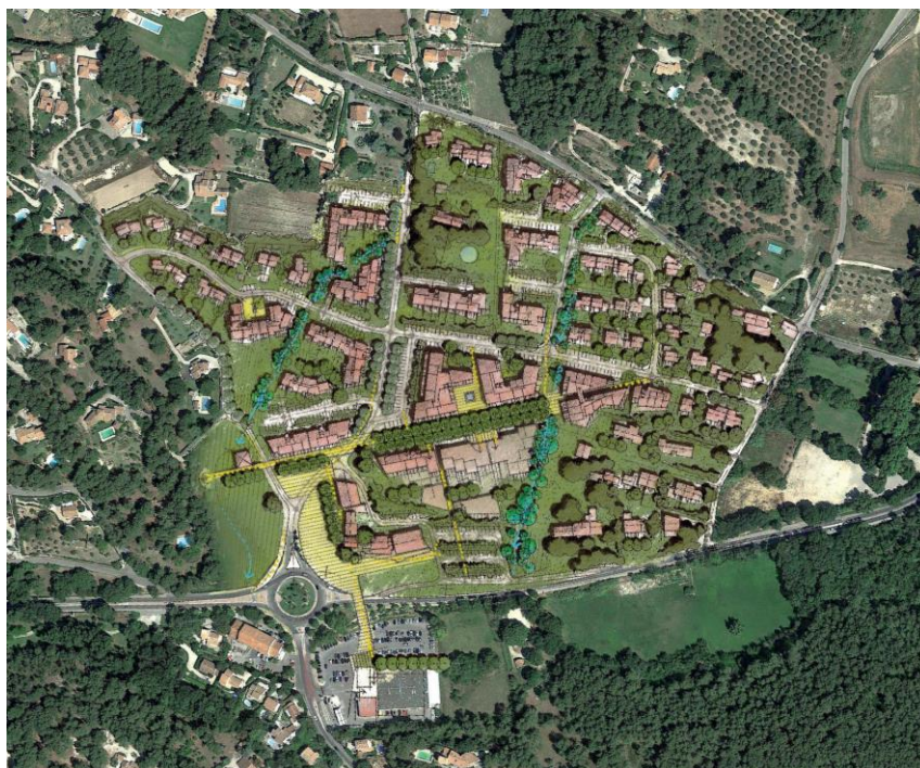
ZAC de l'Héritère

Le groupe scolaire sera le bâtiment pilote de l'opération : bâtiment à énergie positive.