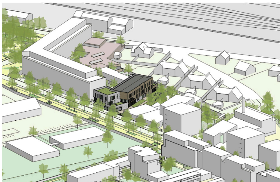
Modélisation – Insertion du bâtiment dans son environnement

Le projet consiste pour Continental Foncier en la construction d'un immeuble de bureaux où il pourra installer son nouveau siège à Brétigny sur Orge, au sein de la ZAC Clause-Bois Badeau actuellement en cours d'aménagement. L'immeuble accueillera également un centre Pôle emploi et un commerce.