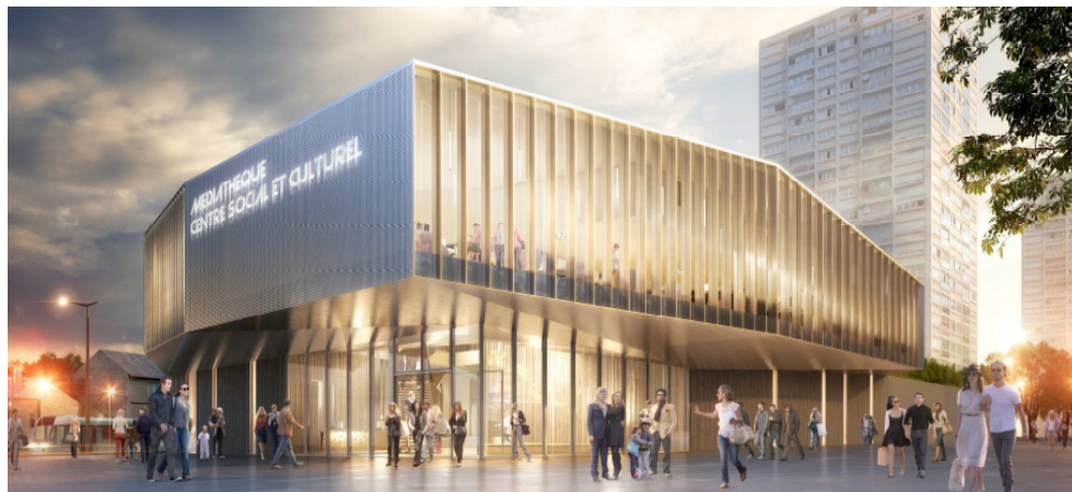
Perspective depuis l'avenue Stalingrad