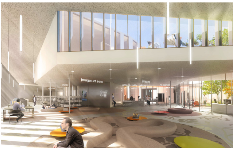
Croquis d'ambiance de la médiathèque

La ville de Colombes prévoit la construction d'un nouveau bâtiment accueillant la médiathèque, le centre social et culturel et des locaux associatifs. Ces trois entités seront regroupées dans un seul équipement public. Ce bâtiment sera construit dans le secteur des Fossés - Jean Bouviers, dans le cadre du projet de Rénovation Urbaine.