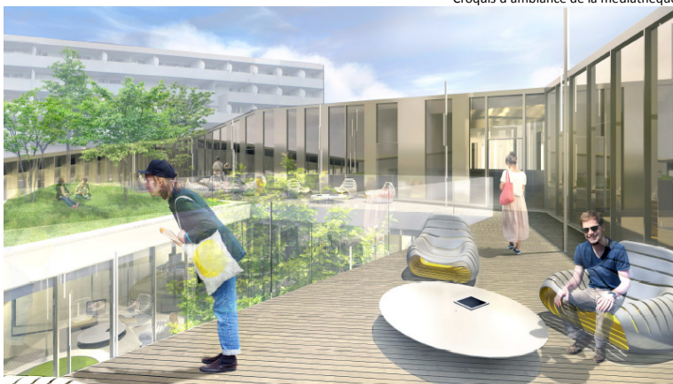
Croquis d'ambiance de la terrasse