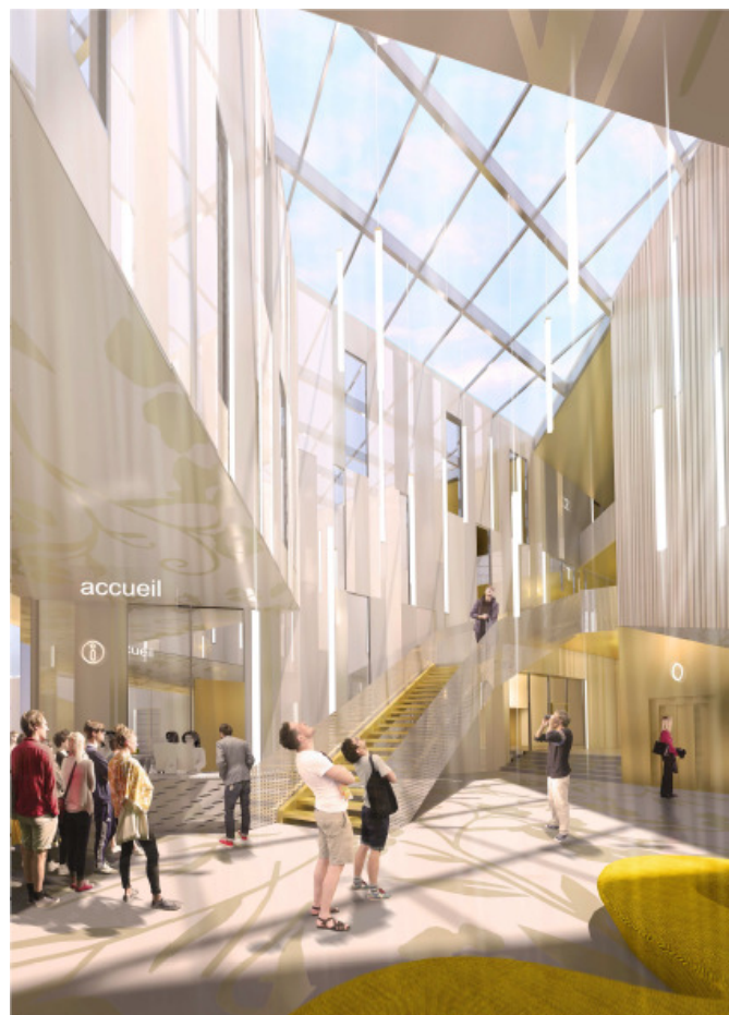
Croquis d'ambiance du hall