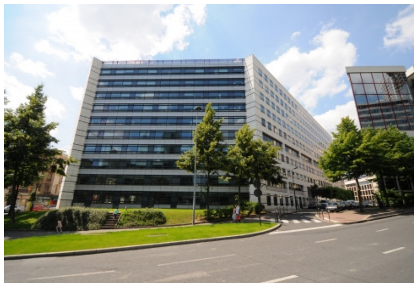
Vue du Diamant

Une évaluation a été réalisée sur la qualité environnementale du bâtiment et des pratiques et un plan d'actions a été défini pour optimiser la QEBE du « Diamant » et la QEP des utilisateurs.