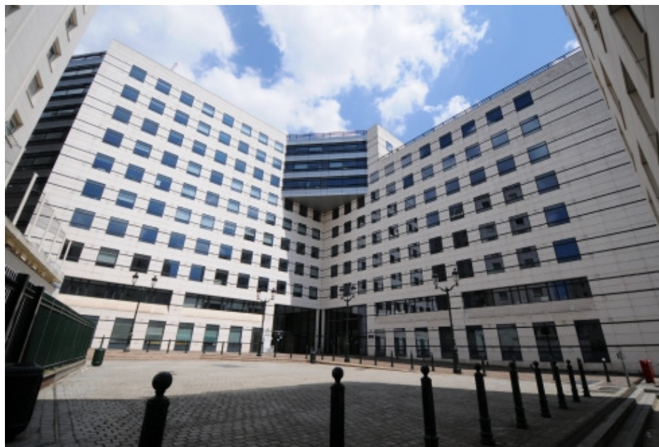
Vue de l'entrée du bâtiment le Diamant