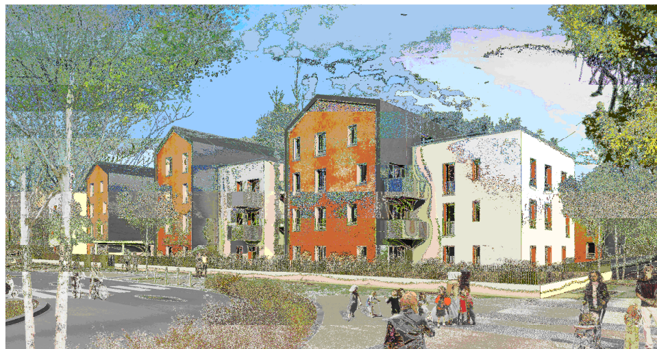
Vue en perspective des logements