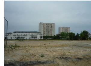
Vues du site