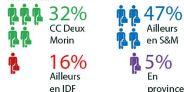
Pourcentage des moyens de déplacement BM