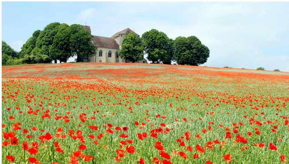
PHOTO DU TERRITOIRE

Située à l'extrême est de la Seine-et-Marne, en bordure de l'Aisne et de la Marne, la Communauté de communes des Deux Morin est le résultat de l'union de la Communauté de Communes de la Brie des Morin et de la Communauté de communes du Cœur de la Brie depuis le 1 er Janvier 2017.